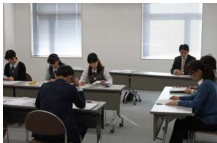
市担当者の方から「がん検診受診の現状」についての説明をいただきました