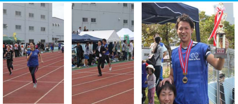
<80M走> スーツで走ったつわものもいたぞー！