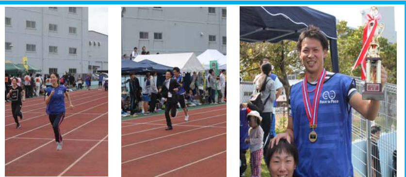
<80M走> スーツで走ったつわものもいたぞー！