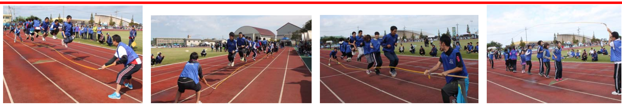
<大縄跳び> しんきん最高記録は「チーム四谷」の29回！！

10月4日(日)に「第10回市民大運動会」が柏崎市陸上競技場にて行われ、「職域種目」「自由参加種目」に金庫職員として総勢48名で参加させて頂きました！日頃の運動不足から、月曜日の仕事に影響があった！？職員もいたようですが、楽しく参加させて頂きました！ みんな「しんきん」に気づいてくれたかな？