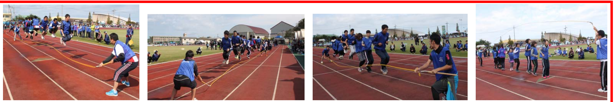
<大縄跳び> しんきん最高記録は「チーム四谷」の29回！！

10月4日(日)に「第10回市民大運動会」が柏崎市陸上競技場にて行われ、「職域種目」「自由参加種目」に金庫職員として総勢48名で参加させて頂きました！日頃の運動不足から、月曜日の仕事に影響があった！？職員もいたようですが、楽しく参加させて頂きました！ みんな「しんきん」に気づいてくれたかな？