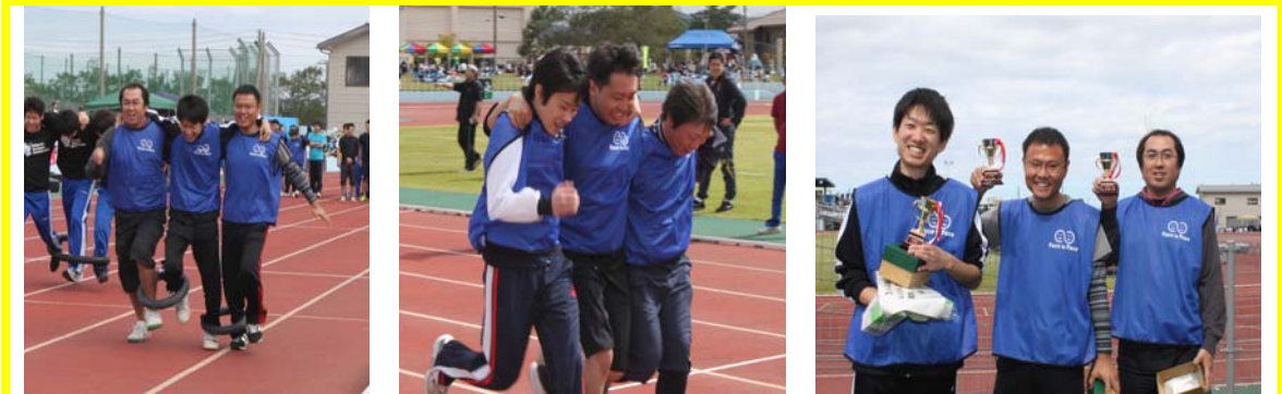
<3人4脚レース> 日頃のチームワークをいかに発揮！？