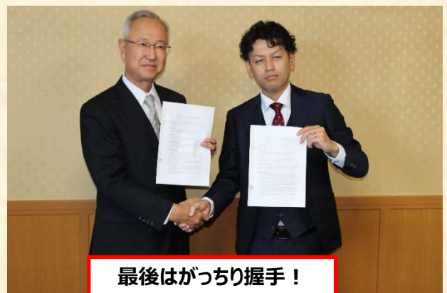
最後はがっちり握手!